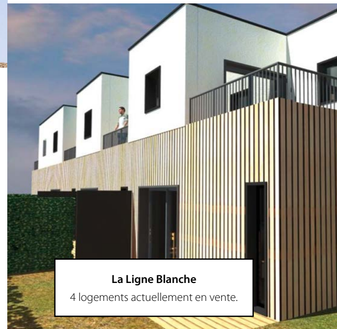
La Ligne Blanche 4 logements actuellement en vente.